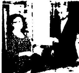
L'ASBL La Source Vie (Lasne) a reçu un chèque de 3 400 €.

Le solde, soit 23 600 €, a été distribué aux associations suivantes, toutes basées à Wavre ou dans les environs : l'ASBL Wavre Solidarité, l'ASBL Camp de vacances des enfants de Limal, la Maison maternelle du Brabant wallon, l'ASBL Thérèse Wante, le Télévie, le Télédon, ainsi que le festival Unisound. ■