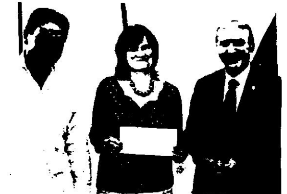
L'ASBL Zam-Med (Jodoigne) a reçu un chèque de 9 800 € pour son projet d'aménagement de puits d'eau potable en RDC.